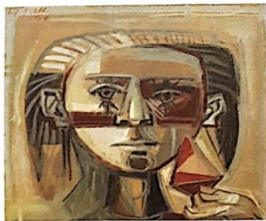
Enrique Grau, Sin título. Gouache sobre papel colocado en tabla aglomerada (1959).