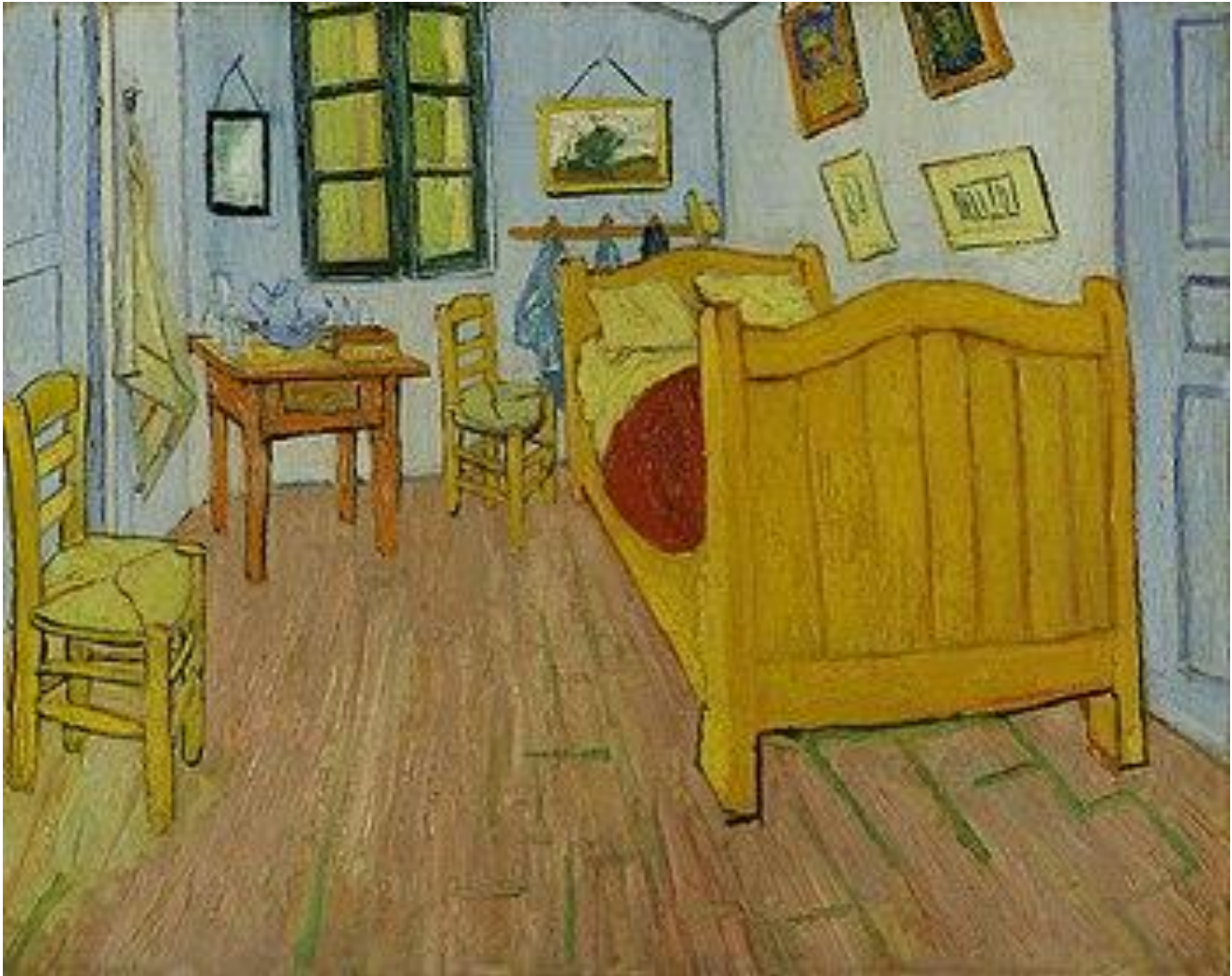
Vincent van Gogh, Recámara de Vincent en Arles. Óleo sobre tela (1888).

Posteriormente realiza un análisis a la siguiente imagen, dándole una “primera mirada”