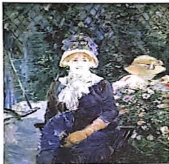
Berthe Morisot, Mujer en un jardín . Óleo sobre tela (1883).

Al observar una imagen artística en general experimentamos un primer impacto; si no estamos preparados, difícilmente logramos explicar esa experiencia y nuestra relación con el arte termina siendo superficial. La intención de esta práctica es ofrecerte herramientas para que observes, analices y reflexiones al respecto, lo que implicará poner en acción los conocimientos y las habilidades que hayas logrado en esta materia durante este curso y los anteriores. Para hacer un análisis organizado y completo de una obra vamos a distinguir tres momentos o "miradas" que a continuación explicaremos.