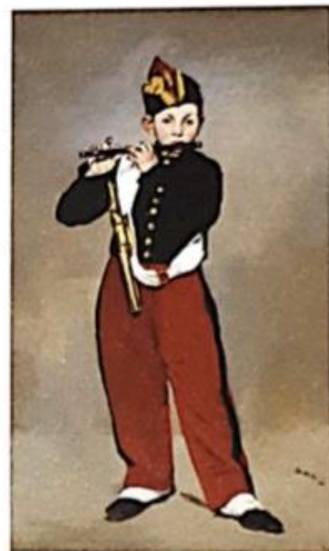
Edouard Manet, El tocador de pífano . Óleo sobre tela (1866).