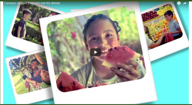
Conozco, respeto y convivo con los demás

Conozco, respeto y convivo con los demás.