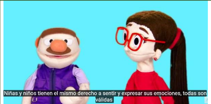
Niñas y niños tienen el mismo derecho a sentir y expresar sus emociones, todas son válidas

https://www.youtube.com/watch?v=sk8bxtttd4&feature=player_embedded